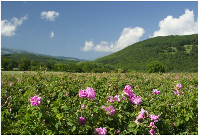
Tal der Rosen

Ebenfalls im Tal der Rosen befindet sich ein weiterer Höhepunkt Ihrer Reise: die Thrakische Grabstätte von Kazanlak (UNESCO-Welterbe) aus dem 4. Jh. v. Chr. Das eigentliche Weltkulturerbe kann aufgrund seiner empfindlichen Malereien nicht besichtigt werden. Doch nur wenige Meter entfernt steht eine originalgetreue Nachbildung. Es untermauert den hohen Entwicklungsgrad der thrakischen Kultur. Künstlerisches Highlight der Anlage ist das wunderbare Deckengemälde , auf dem das Thrakische Königspaar sich im Angesicht des Todes zärtlich die Hände hält.