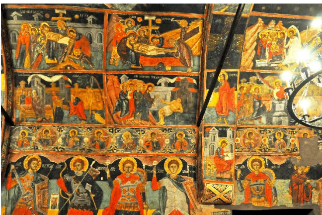
Arbanassi Christi-Geburt-Kirche

Eine kurze Fahrt bringt Sie in das Dorf Arbanassi, welches ein Kleinod bulgarischer Architektur darstellt.