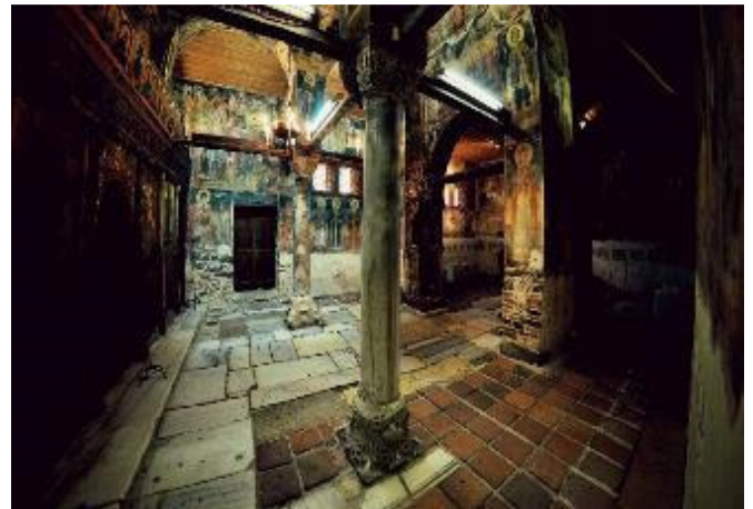
Nessebar – St. Stephan Kirche

Nach dem Frühstück Fahrt nach Nessebar (UNESCO-Welterbe).