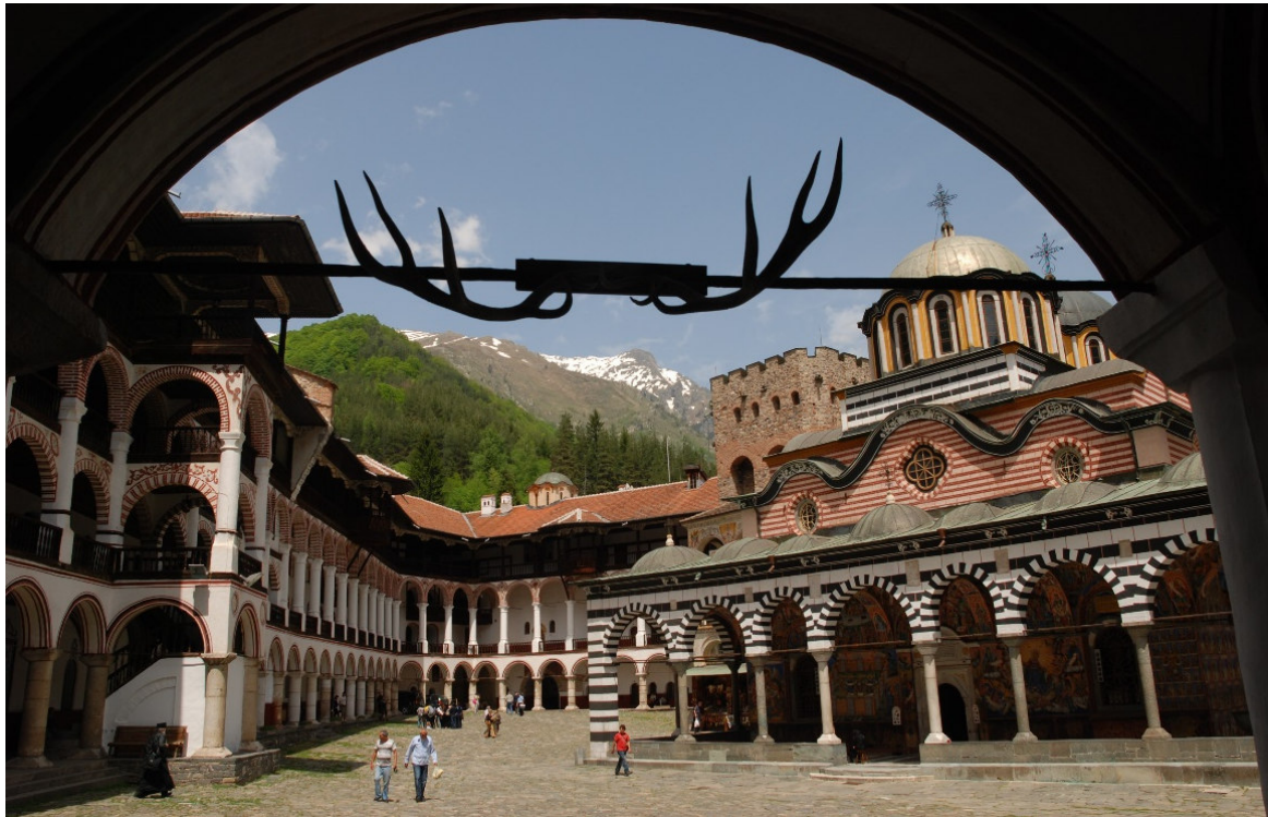
Kloster Rila

Bulgarien, die „ Perle Osteuropas “, liegt mit seinen zahlreichen UNESCO-Kulturdenkmälern zwischen den Goldstränden des Schwarzen Meeres und den bizarren Gebirgsketten des Balkans.