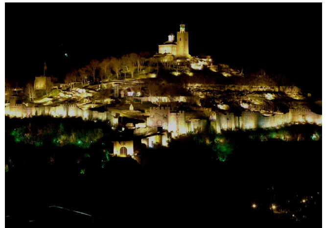
Veliko Tarnovo bei Nacht

Der Nachmittag ist dann ganz der mittelalterlichen Hauptstadt Veliko Tarnovo gewidmet. Sie war kulturelles und wirtschaftliches Zentrum des Landes und während ihrer zweiten Blütezeit im 18. und 19. Jh. reichten die Verbindungen der hiesigen Kaufmannschaft bis nach London, Leipzig und Budapest.