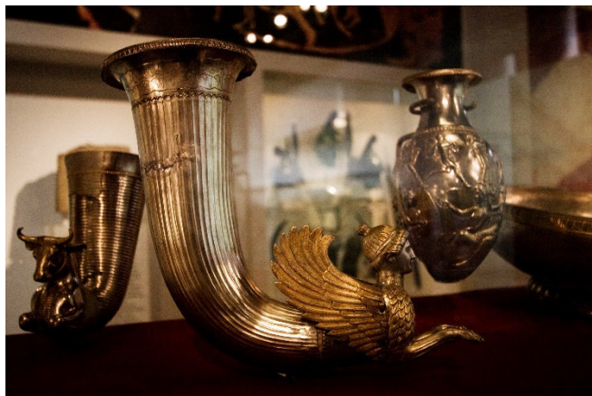
Sofia – Nationalmuseum

Am Vormittag besuchen Sie das Nationalhistorische Museum mit dem „Thrakischen Goldschatz“ und