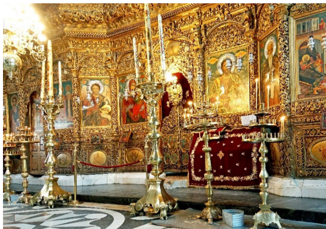
Rila Kloster Hauptkirche

Paläste aus der Gründerzeit stehen neben gläsernen Luxushotels, sozialistische Plattenbauten neben den goldenen Kuppeln der Alexander-Newski-Kathedrale. Und überall sieht man die Zeichen einer jungen Generation , die mit frischen Ideen und Einfallsreichtum dem ehemaligen Einheitsgrau bunte Farben geben.