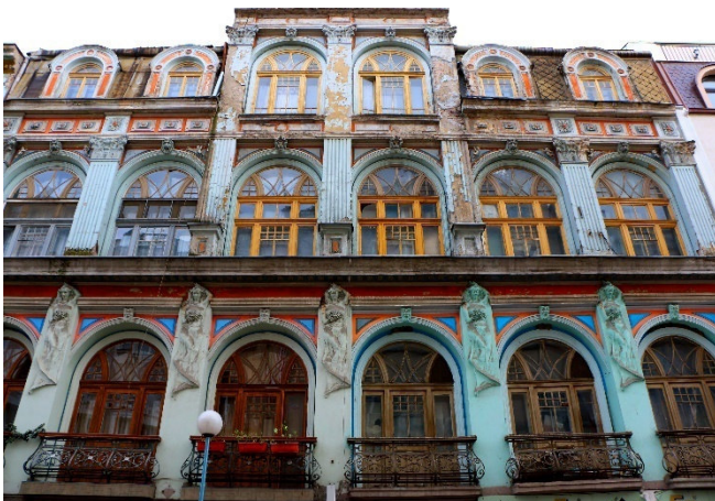
Plovdiv

Der französische Dichter Alfons de Lamartin schrieb über Plovdiv: „Das ist eine der schönsten Ortschaften, die man sich überhaupt vorstellen kann.“